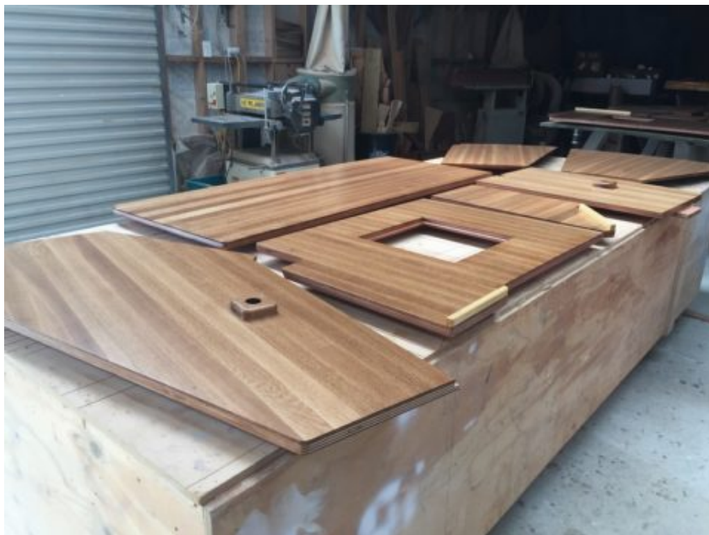
Couverts de 5 couches de résine, ils sont beaux, ils sont chauds, les planchers de Schnapsou !