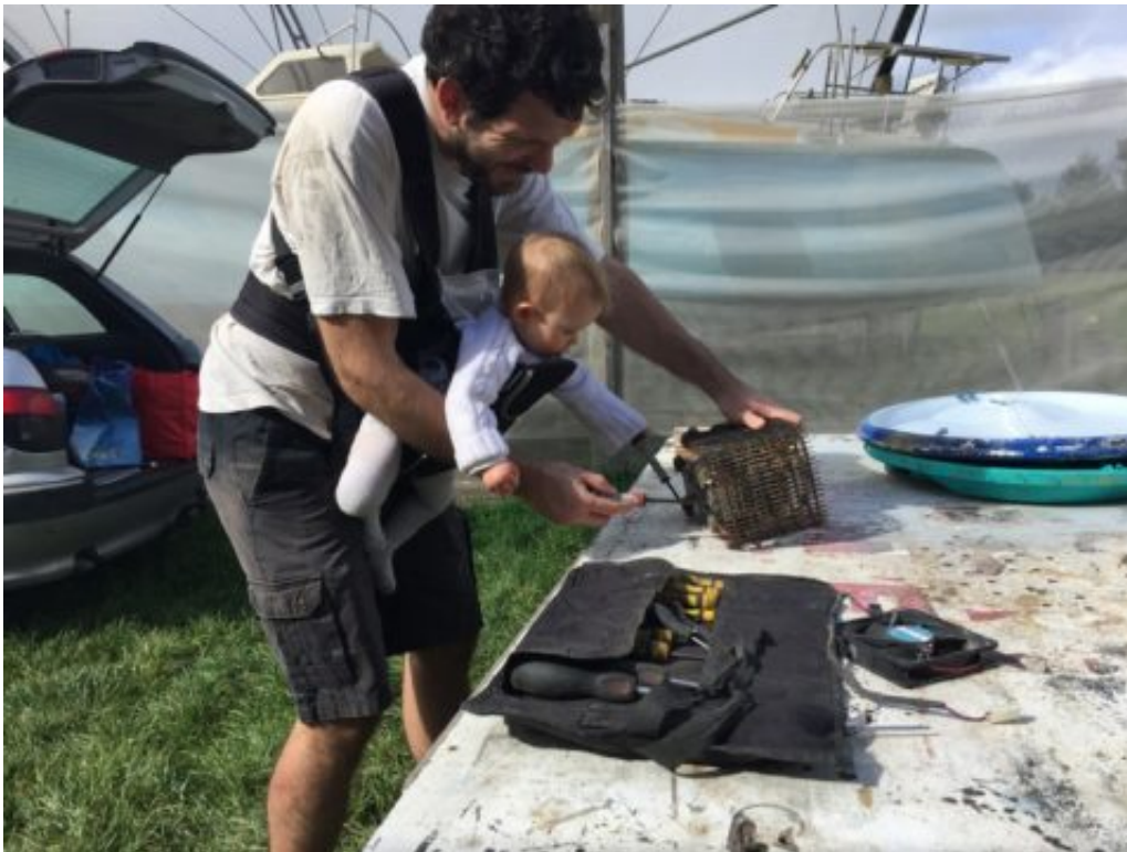
Pendant ce temps-là, Binouille apprend à se servir d'un tournevis pour évaluer la réutilisabilité du compresseur de

Moins photogénique, mais tout aussi satisfaisant : l'axe du safran, qui était légèrement tordu, a été redressé et le tube qui accueillait l'axe du safran dans le bateau a été remplacé. Ajoutons à cela de nouveaux paliers, et le safran tourne comme il n'avait jamais tourné !