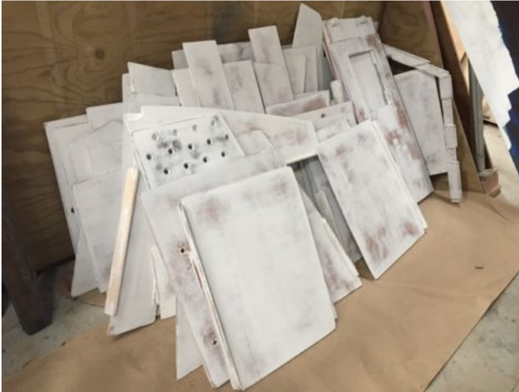
Il y en a un petit tas, des parois démontables.

Moins photogénique, mais tout aussi satisfaisant : l'axe du safran, qui était légèrement tordu, a été redressé et le tube qui accueillait l'axe du safran dans le bateau a été remplacé. Ajoutons à cela de nouveaux paliers, et le safran tourne comme il n'avait jamais tourné !