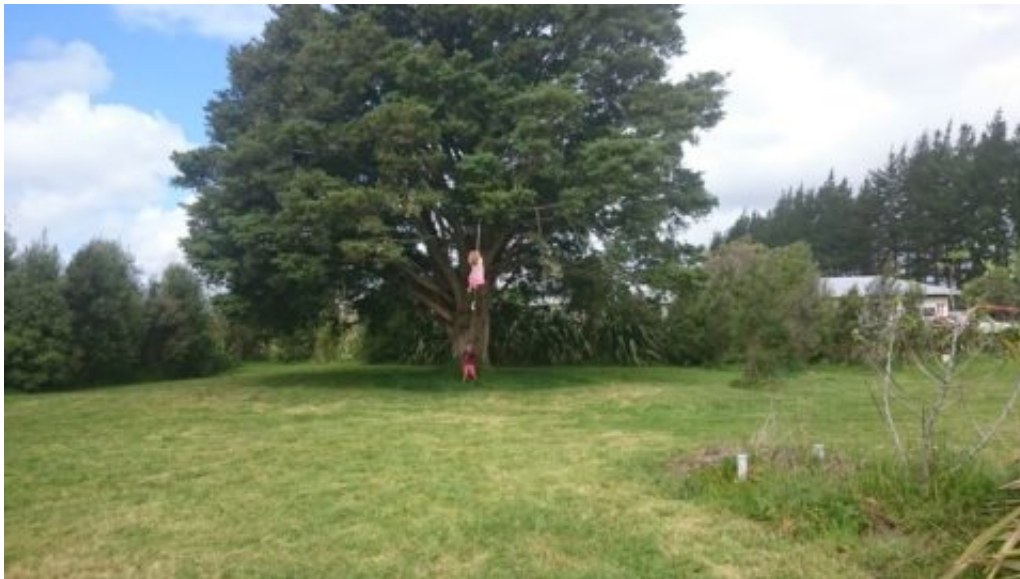
du Totara Tree aux containers

Il y avait bien une tyrolienne... Les gars du chantier ont fait une fête et il se trouve qu'ils voulaient une tyrolienne pour la fête, dont ils ont fabriqué une tyrolienne.