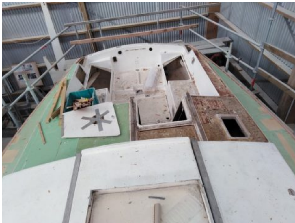
Étape intermédiaire : dégommage du sandwich dans le cockpit et remplacement par de la mousse