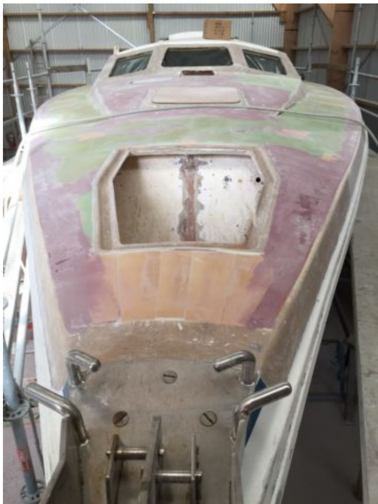
Vue de la proue, nouveau look !

Rien de très excitant ni de très technique, mais ça nous fait toujours plaisir de voir Schnapsou, de discuter avec lui, de prévoir les prochaines étapes.