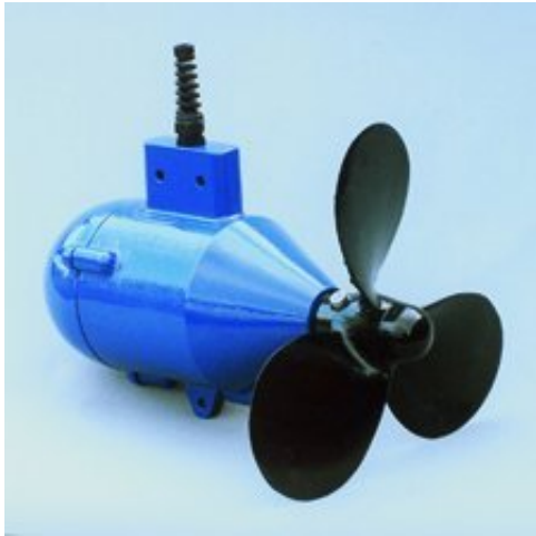
L'Aquair UW 100

Nous avons opté pour la dernière solution, qui semblait présenter le moins d'inconvénients. Et forcément, nous avons voulu jouer aux plus malins en installant un des seuls produits (si ce n'est le seul) disponibles sur le marché grand-public : l'Ampair 'Aquair' UW 100, qui n'est rien de plus qu'un gros alternateur relié à une grosse hélice, destiné à être placé dans un écoulement. C'est bien précisé sur le site du fabricant : ce n'est pas vraiment fait pour les bateaux (il y a un modèle pour ça mais qui correspond au 2ème point ci-dessus) mais plutôt pour des installations fixes (pour alimenter l'éclairage de la cabane au fond du jarding grâce à la rivière qui coule au fond du jarding par exemple). Sur le net, personne ne semblait avoir franchi le pas d'installer cette grosse bestiole à l'arrière de son bateau, ou personne n'osait en parler. Comme, nous l'avons dit, on aime jouer aux plus malins, on s'est dit qu'il n'y avait pas de raison que ça ne marche pas, et que ce serait quand même chouette de pouvoir produire 1 ampère par nœud en permanence.