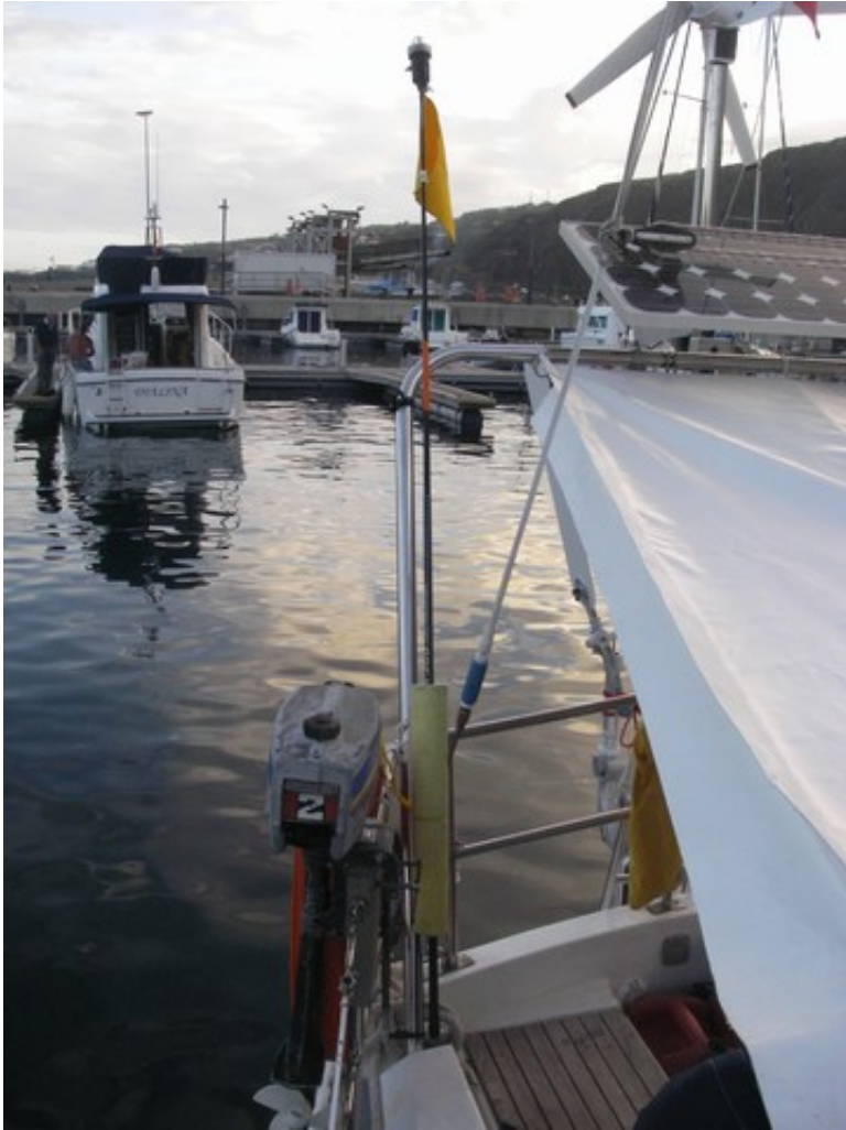
La perche déployée