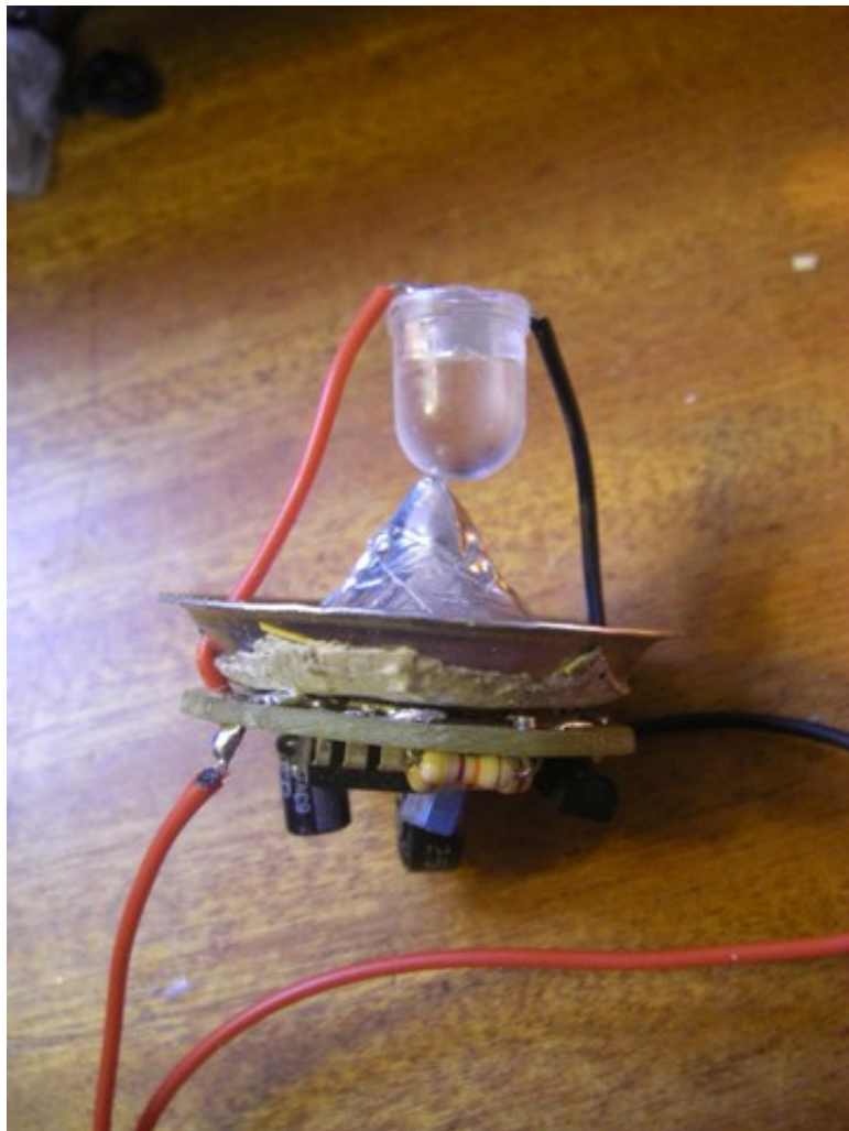
Petit zoom sur la LED de forte puissance et son cône de diffusion de la lumière en mastic époxy et papier alu adhésif