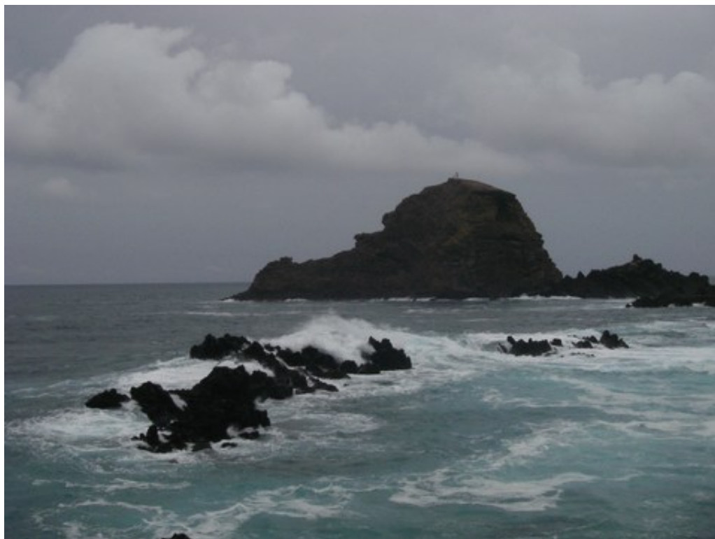
La baie de Porto Moniz, assaillie par la houle

On a donc presque tout eu de Madère, pour cette promenade : le plateau désertique, tout là haut, la forêt d'altitude, la levada, les tunnels, la forêt sub-tropical, la pluie, l'arrivée sur la mer et la baignade ... Histoire de clôturer en beauté ce chapitre !