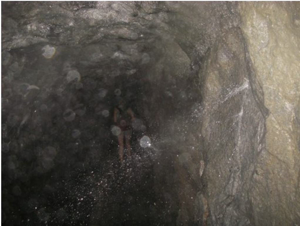
Les traditionnels tunnels, avec leurs jets d'eau sous pression à hauteur d'épaule (sympa !)