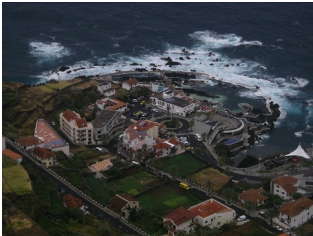
L'arrivée sur Porto Moniz : la grande houle de Nord se brise sur les rochers ...