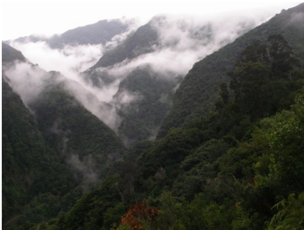
Les nuages jouent à saute-vallon entre les pentes escarpées