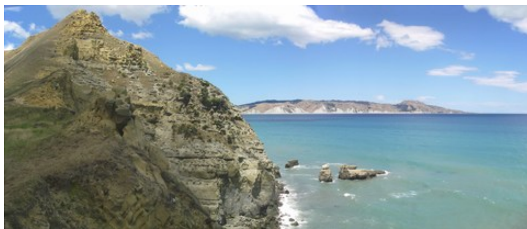
La péninsule de Mahia, entre Napier et Gisborne

Pour voir à quel point la Nouvelle-Zélande c'est joli on ne peut que vous engager à aller voir l' album photos et les superbes panoramas que Tomtom a recousus . En résumé, on retournerait bien à New Plymouth du côté du Mont Egmont pour y faire des balades par beau temps, la Forgotten World HighWay n'est pas inoubliable, la côte Est et son arrière-pays sont superbes, et la péninsule de Coromandel on a boycotté parce qu'ils interdisent le camping sauvage, sous prétexte que les freedom campers (les gens qui font du camping sauvage) laissent des déchets partout. C'est vrai qu'on a de temps en temps vu des détritrus dans la nature : des sacs poubelle de 100 litres, un repas de midi jeté par terre, des morceaux de dalle de béton armé avec des gros gravats, des vieux fauteuils troués, une voiture carbonisée (accident de réchaud, probablement), des commodes défoncées ... C'est fou, non, ce que les freedom campers peuvent laisser sur leur passage ?