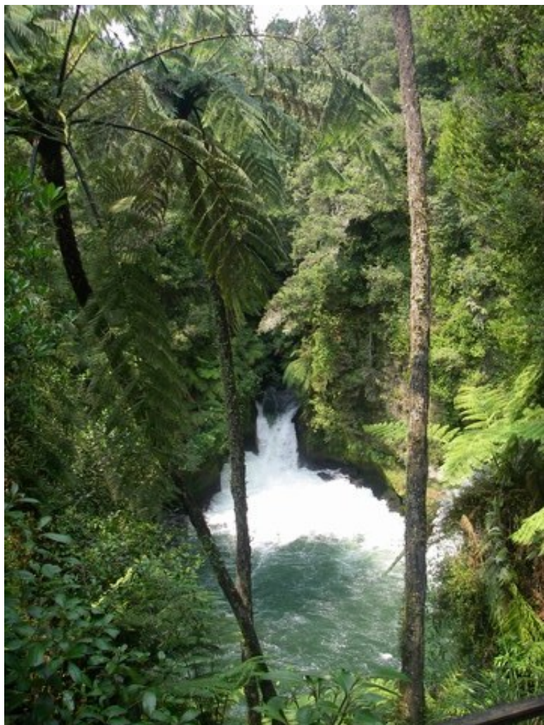
Une des nombreuses cascades de l'île du Nord