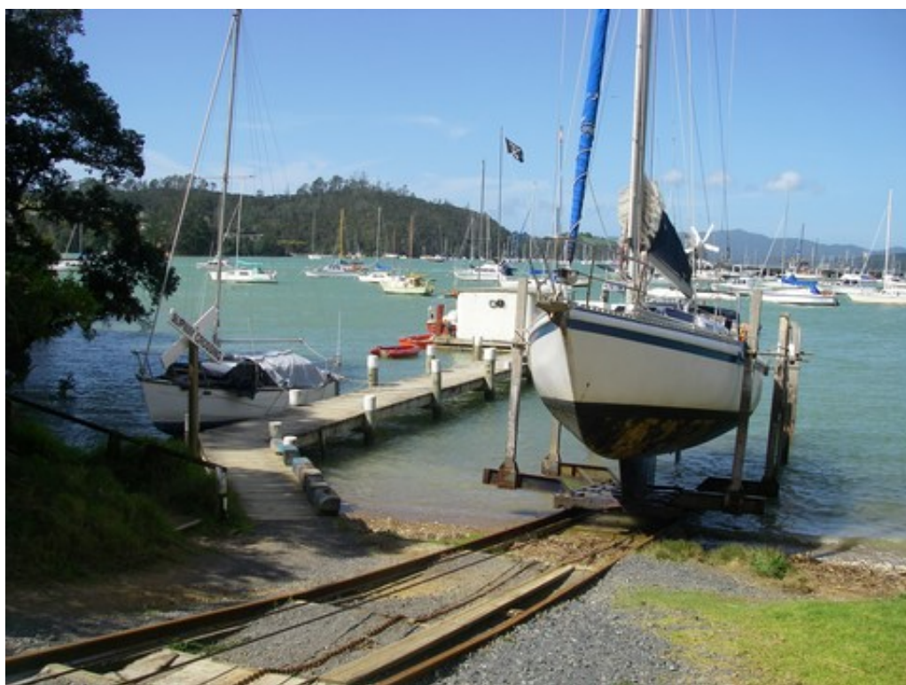
Schnaps sort sur les rails, comme sur des roulettes !!