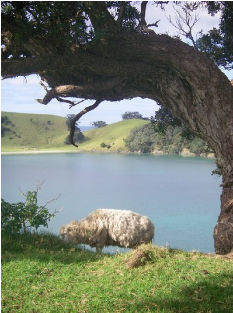
Un mouton d'Urupukapuka

Là aussi, on était juste 3 français, et plein de kiwis un peu stressés (il fallait entendre le cri de soulagement après la tentative ratée de François Trinh-Duc...), parce que notre équipe leur a sorti un vrai match, quelque-chose de beau, de vaillant, de courageux, bref, du beau rugby, à quoi les All Blacks ont répondu par un jeu sans fautes, et finalement ils ont gagné. Ils l'avaient bien mérité. Évidemment, nous on encourageait toutes les actions des Bleus, soutenus par un Australien qui en voulait aux Blacks d'avoir gagné le match précédent, et par un jeune kiwi qui a retourné sa veste en voyant que les Bleus jouaient bien. On applaudissait aussi les jolies actions des Blacks, parce que c'est du rugby, et c'est comme ça. Si on oublie un Kiwi trop excité et pas franchement classe qui a débordé jusqu'à insulter l'arbitre et même un peu nos joueurs mais bon est venu s'excuser à la fin quand on lui a dit que ça se faisait pas, on a encore eu une démonstration de l'accueil néoZ et de la gentillesse de leurs habitants. Beaucoup sont venus à la fin du match nous serrer la main et nous féliciter pour la qualité du match (même si nous on n'a pas fait grand-chose à part crier "OUUUUUAAAAIIIIIISS" quand Dusautoir a marqué le seul essai français), discuter avec nous, et l'un d'eux nous a même offert son drapeau All