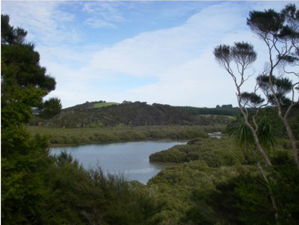
La rivière de Waitangi