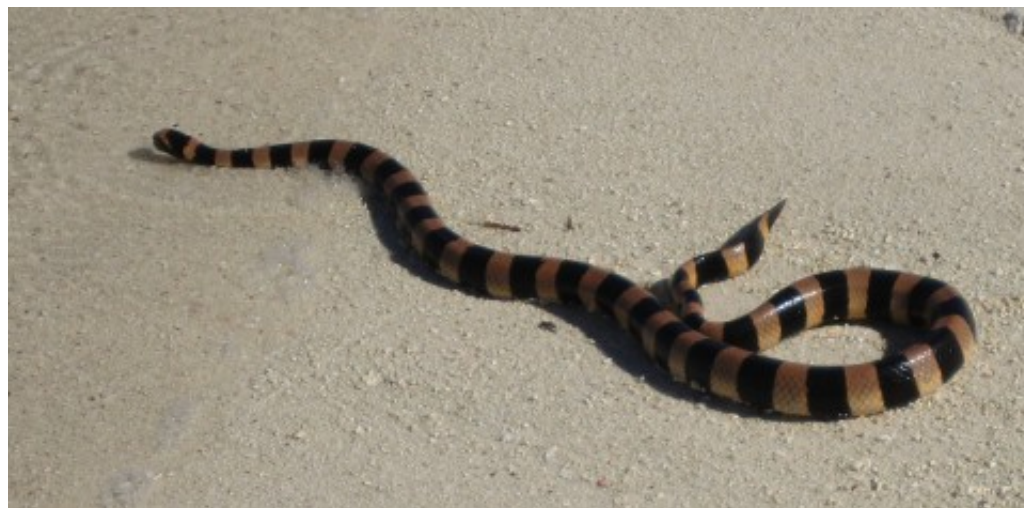
Un Tricot rayé