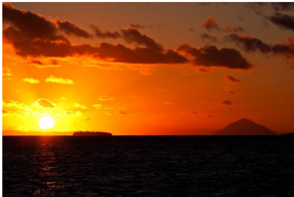
Adresse de cet article :