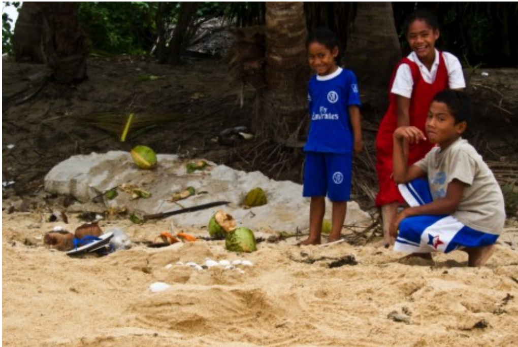
Quelques débris du goûter offert par les enfants