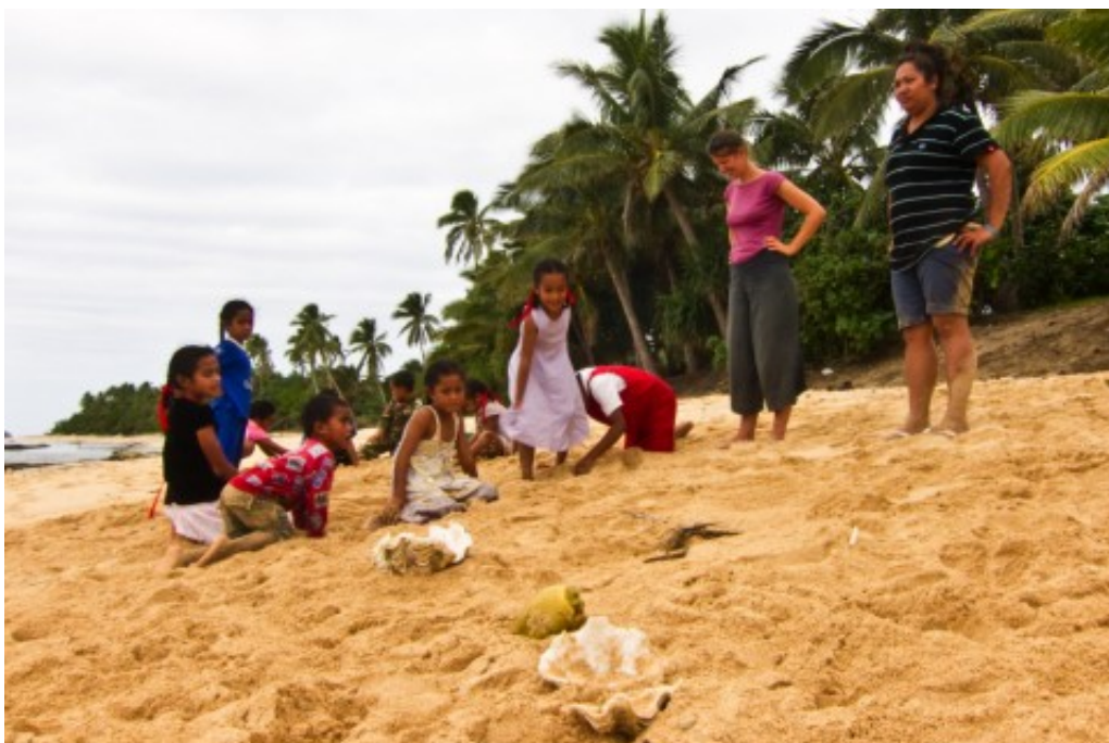
Un Pictionary en 3D !