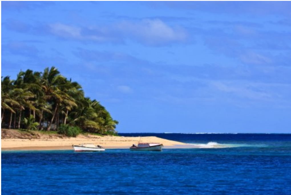
"L'Ile aux enfants"