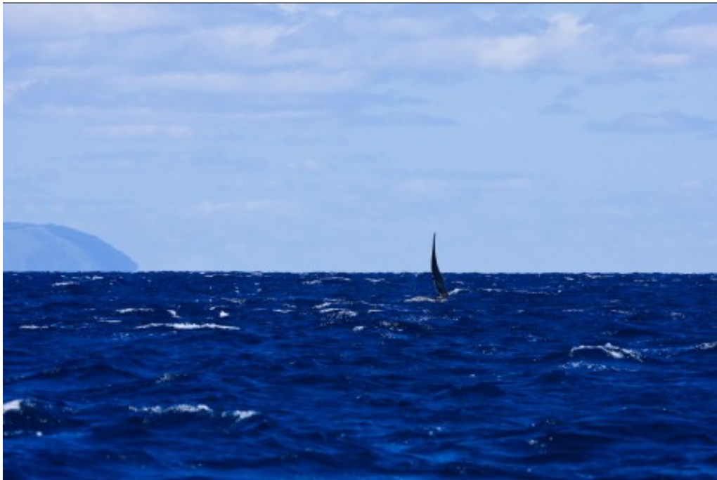
La "grosse bête"

"- Là-bas ! Euh... RECIF ! Euh... Euh... Un truc, euh... Dauph... Bal... Euh... GROSSE BETE !!!"