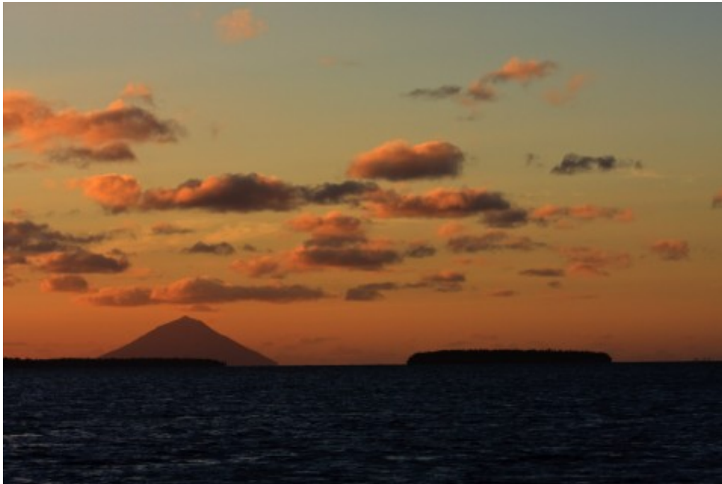
Le volcan Kao - 18h18