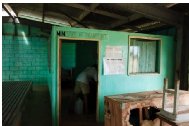
"Ministry of transport"

Dernière escale au Royaume des Tonga, et porte de sortie du pays : Lifuka. Il faut en effet se prêter à un ballet entre moult bureaux et accomplir les formalités de rigueur dans un port homologué pour pouvoir quitter le pays en règle. Nous avons choisi Lifuka, capitale de Ha'apai, le groupe d'île où nous nous trouvons, en redoutant que la ville soit aussi hostile que Nuku'alofa d'où nous sommes partis. Finalement, tout se règle rapidement entre seulement deux bureaux et cerise sur le gâteau, nous trouvons un accès gratuit à l'eau potable ! Les filles font les navettes jusqu'au bateau pour remplir d'eau douce les jerricans tandis que les gars vont faire tamponner les passeports aux bureaux de l'immigration. Là, miracle, ni racket, ni taxes inventées, rien à payer pour avoir les quatre tampons - contrairement à ce que nous avaient raconté les douaniers en jupette de Tongatapu. Juste quelques sourires et nous sommes en règle !