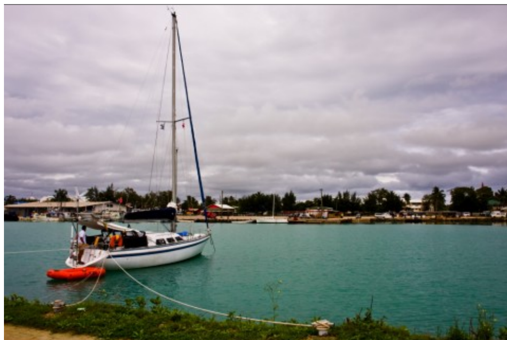
Nuku'alofa : charmant port de pêche

N'y allons pas par détours : la ville est moche, mal ravitaillée et ne présente aucun intérêt. La pauvreté du pays n'explique pas tout, nous le découvrirons plus tard, plus au Nord. Ici les rues sont sales, les gens vous évitent, vous méprisent. Les officiels sont bêtes et nuisibles (" Quand les cons sont braves " comme dirait Brassens). Les magasins chinois ressemblent à des forteresses car, de l'aveu de celui qui nous conduit de l'aéroport au port, "ici on n'aime pas les Chinois".