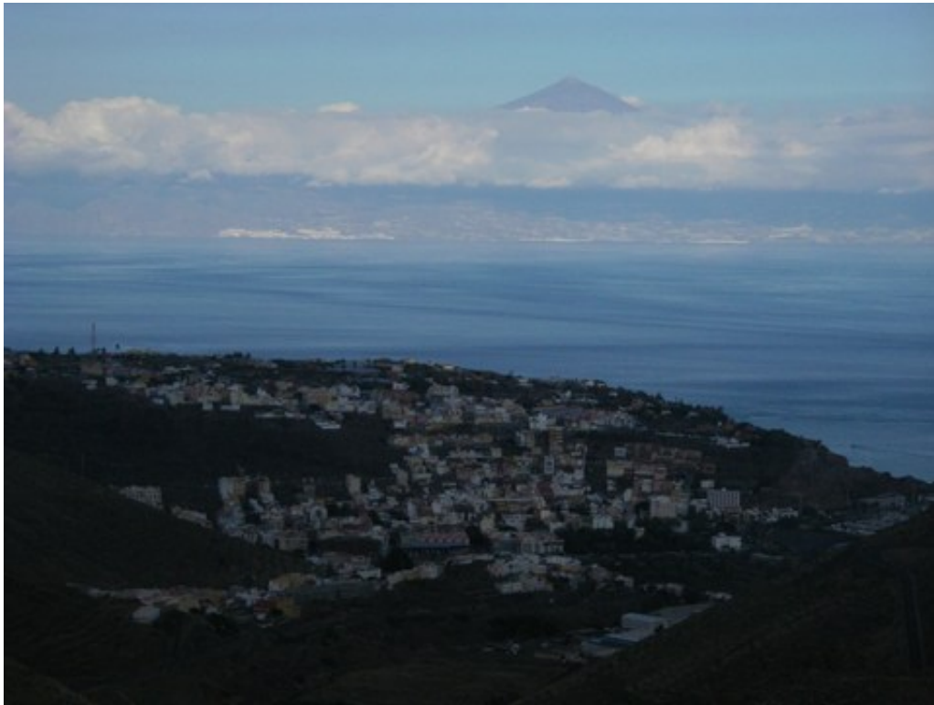
San Sebastian, la capitale de l'île, avec en arrière plan le Teide, plus haut sommet d'Espagne, sur Ténérife.