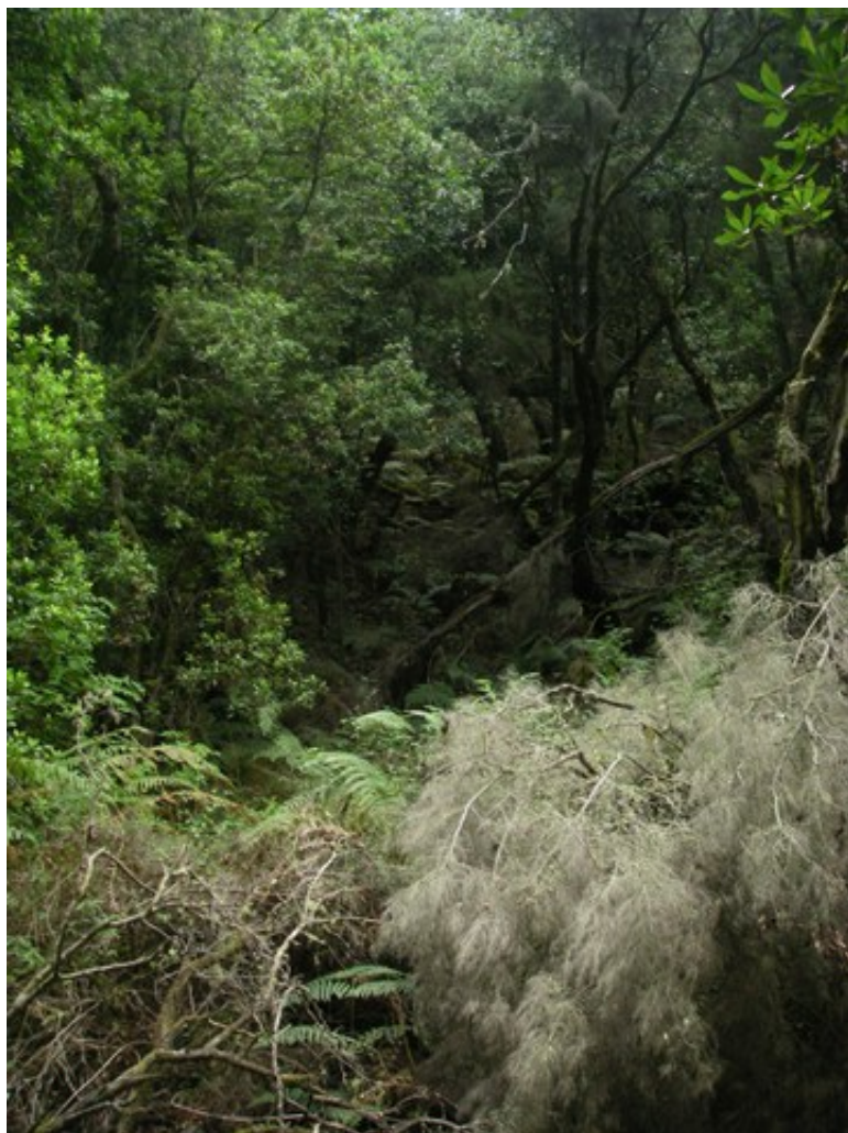
La Laurisylve de La Gomera

Nous avons ensuite poursuivi notre tour dans le sens des aiguilles d'une montre : Vallehermoso, Agulo, Hermingua, San Sebastian (que nous n'étions pas sûrs de visiter plus tard en bateau), puis retour au port de Vueltas par la route du centre de l'île, après une pause en forme de bouquet final au Mirador del Santo à Arure. Je vous laisse quelques photos pour la mise en bouche, la reste est sera incessamment sous peu sur notre espace Picasa .