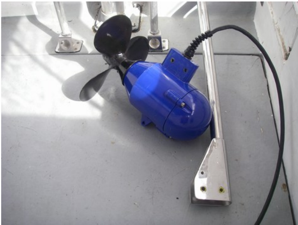
Arsène démonté, dans le cockpit, avec son tube de support en inox

Certes, en le gardant on produirait 5 A quasiment en permanence, mais vu les 2 inconvénients majeurs ci-dessus (dodo et calme des nerfs sérieusement compromis par l'un et temps de trajet non négligeablement augmenté par l'autre), on a préféré admettre que la solution que nous avions choisie n'était pas la bonne, ravalier notre amour-propre, oublier les 1500 euros dépensés pour rien et démonter le tout, au mouillage à Cascais. La jupe est maintenant un peu moins encombrée, et Arsène dort désormais au fond d'un coffre (avec le répartiteur de charge, d'ailleurs), en attendant, peut-être, un jour, d'être utilisé suivant les préconisations de son constructeur, au fond du jarding.