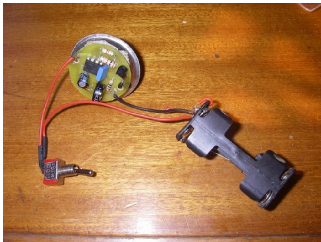
Le montage zélectronique avec son interrupteur à ouverture momentanée