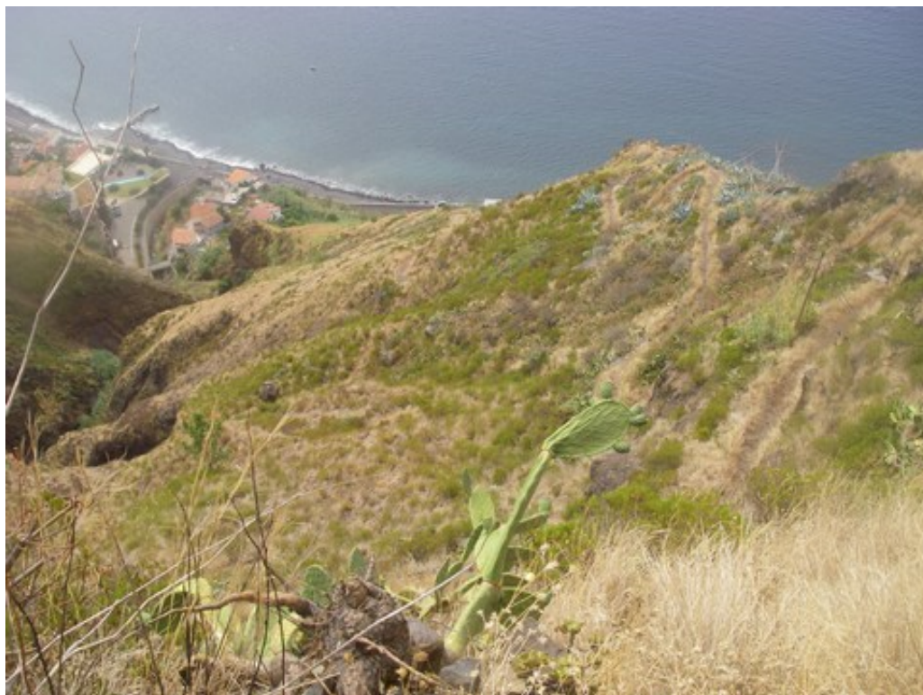
Les lacets du chemin au dessus de Paúl do Mar