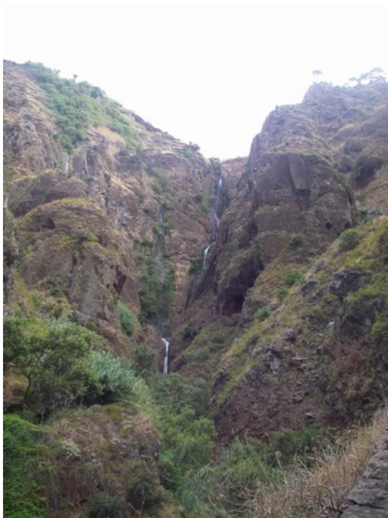
La cascade dévalant le vallon en aval de Prazeres.