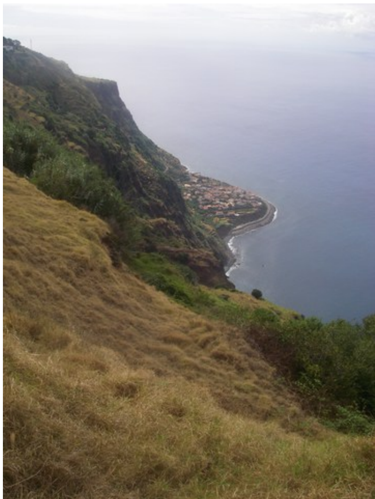
Jardim do Mar

... mais on a réussi quand même, à 2, à arriver en haut !! Girouette est très fière, elle a trouvé une belle plume pour se déguiser en indienne !