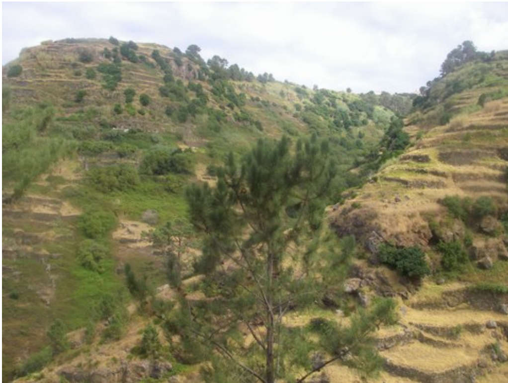
Cultures en terrasses sur le haut du vallon escarpé