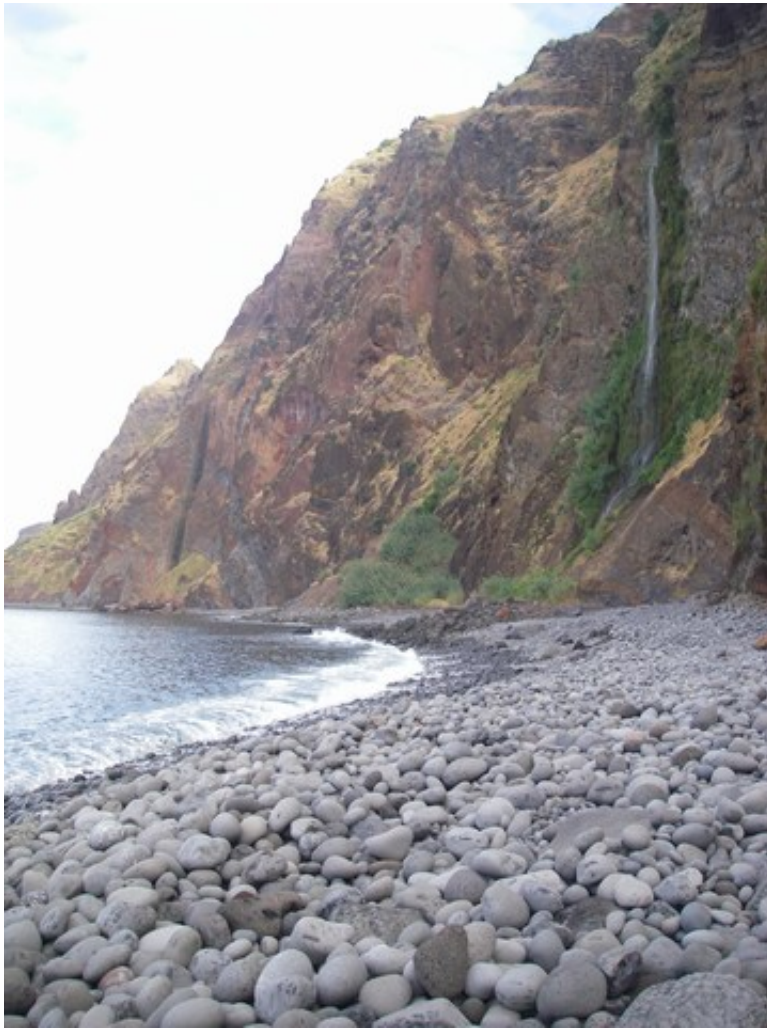
La "plage" de cailloux en bas des falaises.

La première montée, dans un vallon dévalé (huhu un vallon dévalé) par une cascade. J'ai fini la montée tout seul et sans sac mais avec appareil photo (et Girouette), car Clairette s'est arrêtée pour cause de vertige. C'était vraiment très raide (mais bizarrement ma bronchite ne m'a pas gêné du tout, l'effort l'a même faite disparaître temporairement !) et en effet un peu vertigineux, surtout à la descente :