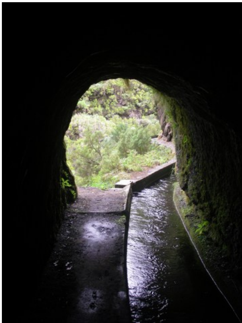
L'entrée du tunnel vue de l'intérieur