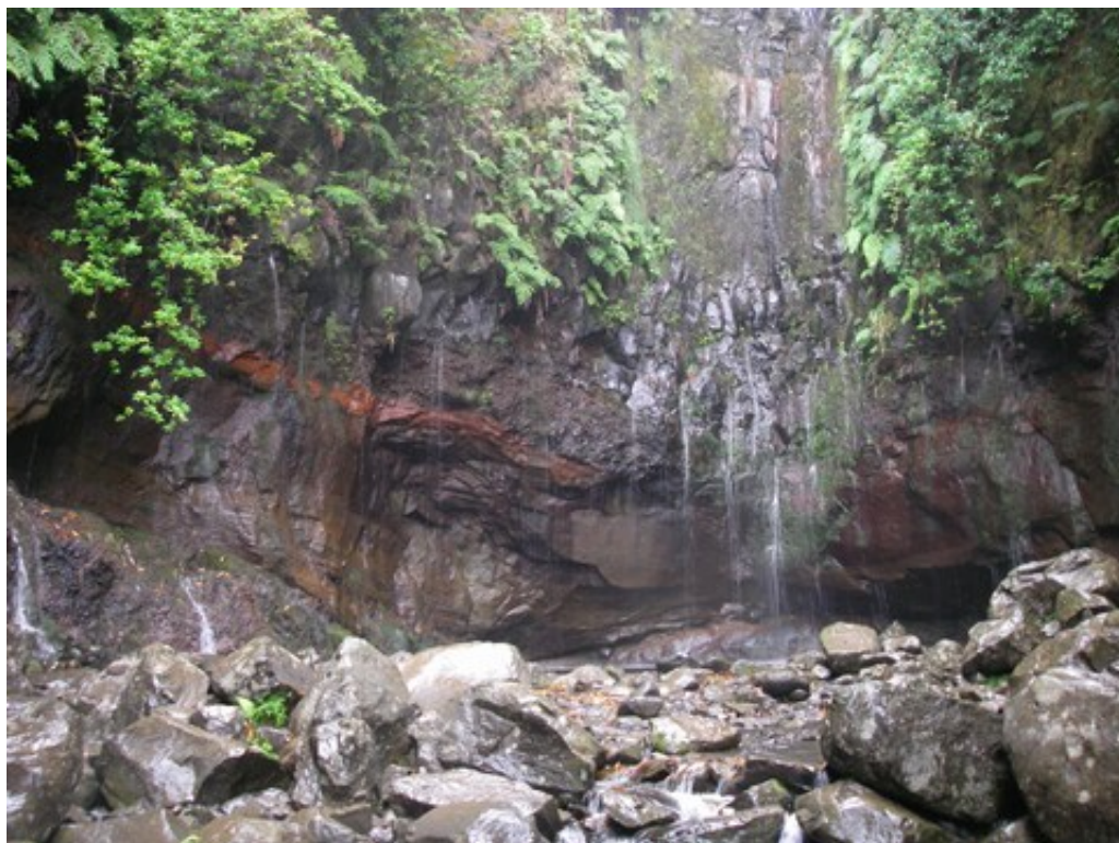
Les 25 fontaines

Nous continuons sur un court sentier indiqué sur notre carte, moins aménagé que la levada précédente, qui suit sur quelques centaines de mètres une mini-levada en amont de la levada des 25 fontaines.