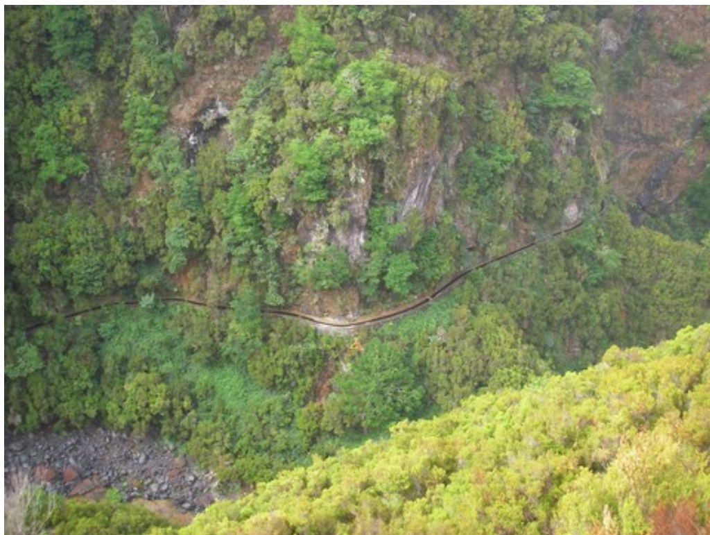
Une levada vue d'en haut

Bref, nous on s'est dit qu'on allait prendre le taxi tôt le matin, se faire déposer à Rabaçal, dans la montagne, pour faire la levada do Risco et la levada des 25 fontaines. Le nom de la première levada est trompeur, il n'y a pas de "risque"... mais une superbe cascade. Et une vue sur la falaise toute verte, fertilisée par les gouttelettes d'eau qui ruissellent.