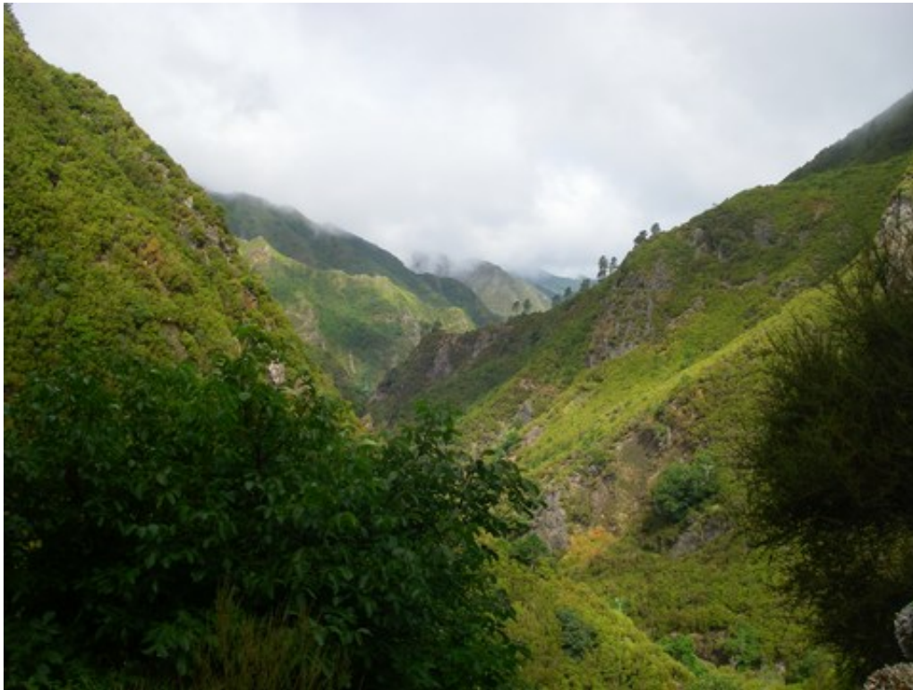
La montagne et ses vallées, vues de la levada

Cette levada passe par un petit tunnel (une cinquantaine de mètres) qui traverse la falaise. Pas besoin de frontale, on voit déjà la fin du tunnel !