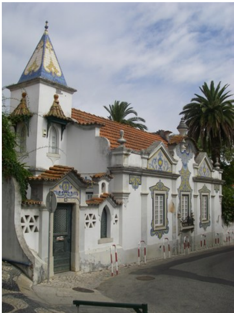
Une jolie maison dans les rues de Cascais.