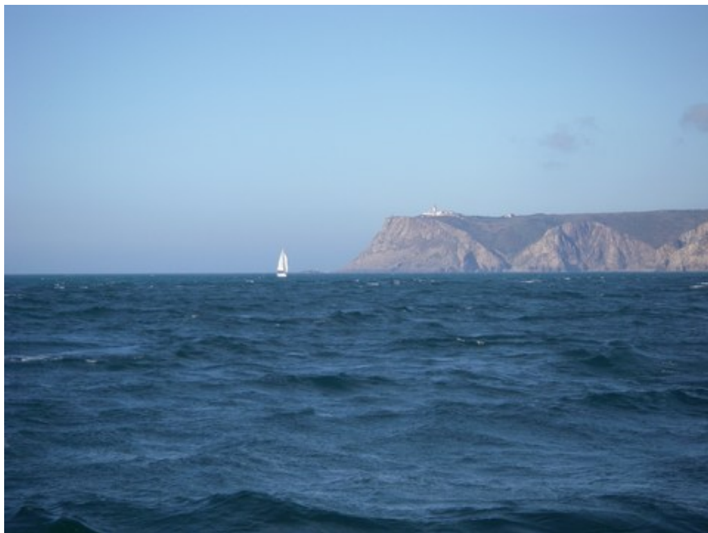
Le Cabo da Roca et un des voiliers qui ne nous rattrapera pas (gniark gniark)