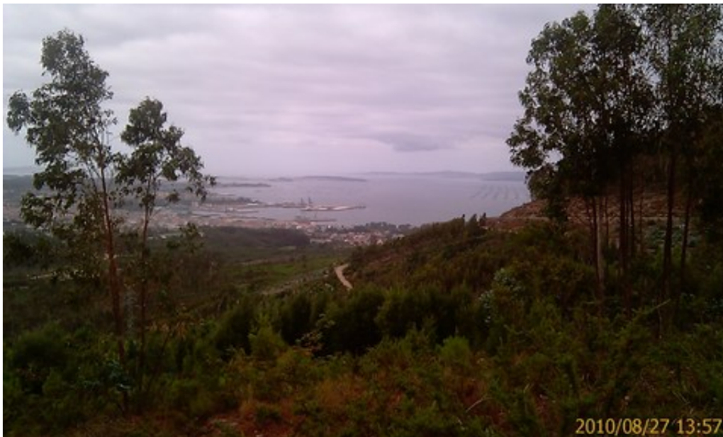
Vue d'en haut de Villagarcia et du port

Bilan de l'Espagne, que nous quitterons pour le Portugal vendredi soir : il n'y fait pas tout le temps beau, on y trouve des déchets partout, pas sûr qu'on se ferait à la vie espagnole, mais on est tombé en général sur des Espagnols gentils et compréhensifs, les achats coûtent bien