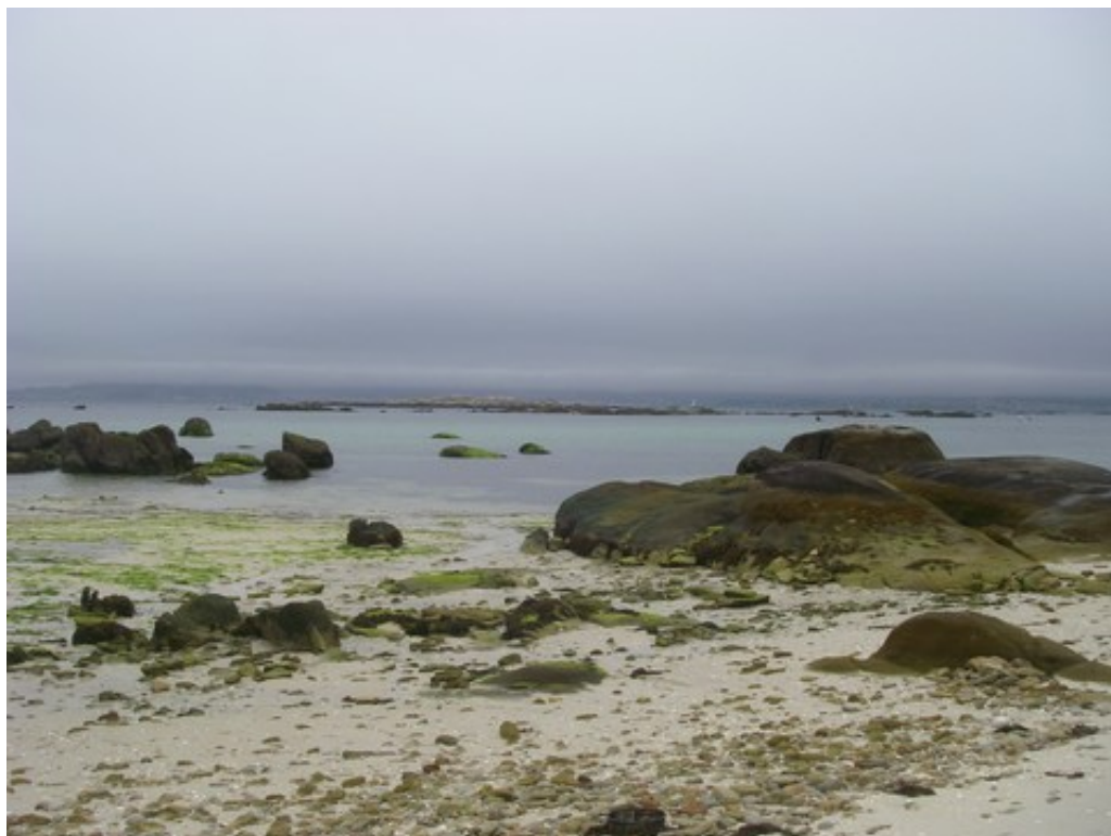
La plage de l'île : sables, rochers et coquillages

De retour à bord, le vent souffle à 25 noeuds (rafales à 30), on apprend que les transistors viennent d'arriver à Villagarcia, donc on y va. Une bonne demi-heure et de nombreux bras musclés seront nécessaires pour remonter le mouillage, puis la navigation s'est bien passée, avec des pointes à 7.5 noeuds sur une mer qui ressemblait à un lac ! En revanche, l'arrivée au port ne fut pas terrible au premier abord : aucune place disponible (sauf celles des voiliers qui ont leur place attitrée, sont en mer et risquent de rentrer d'un moment à l'autre). Il a fallu parlementer - en espagnol - pour avoir l'autorisation de demander à un voilier sur les places visiteurs de se mettre à couple d'eux (le gars du port ne voulait pas le leur demander, je suppose pour ne pas les déranger). Les gens du voilier étaient très sympa : ils nous ont fait une petite place très gentiment. Tant mieux, on avait vraiment besoin de l'électricité du quai pour dessouder, ressouder, tester les transistors du pilote.