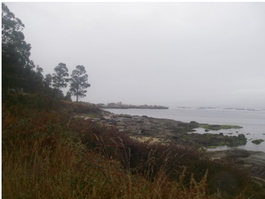
Le long de la côte (au loin, on voit les parcs à huîtres)