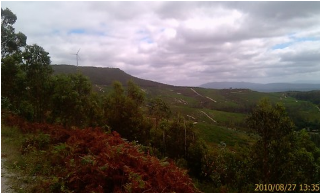
Les éoliennes sur la crête