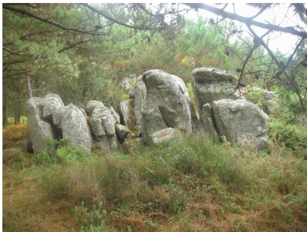
Une famille de pierres