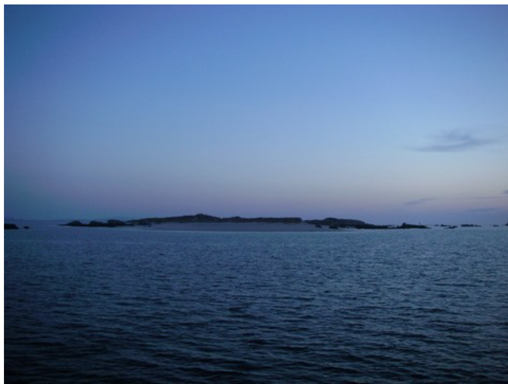
Islote Jidoiro Arenoso, vu du mouillage