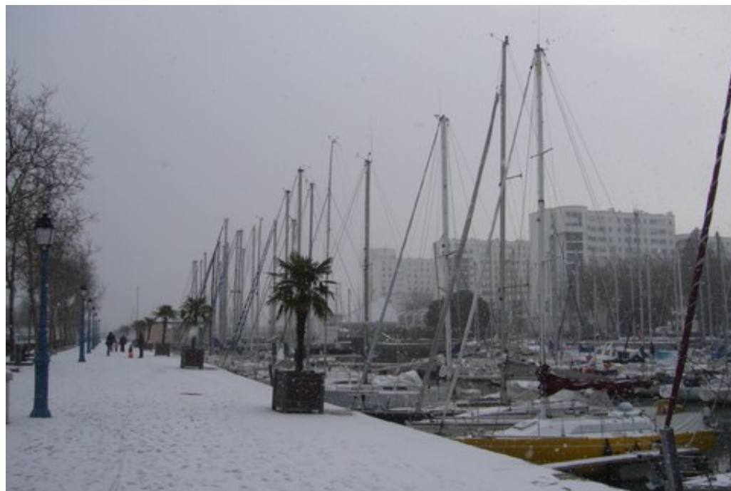
Le port de Lorient sous la neige

Deux petites photos de Schnaps quand même :