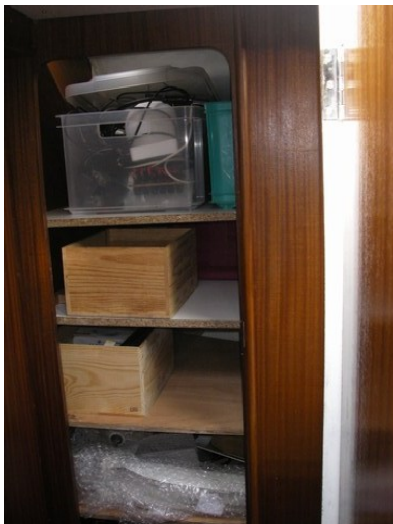
Les anciennes toilettes transformés en étagères

Et voilà, on a des étagères, qui pour l'instant abritent notre bazar (celui qui encombrait le carré avant) et en particulier notre éolienne, reçue il y a peu, et qui attend qu'on s'équipe d'un portique pour trôner fièrement à l'arrière de Schnaps... affaire à suivre !