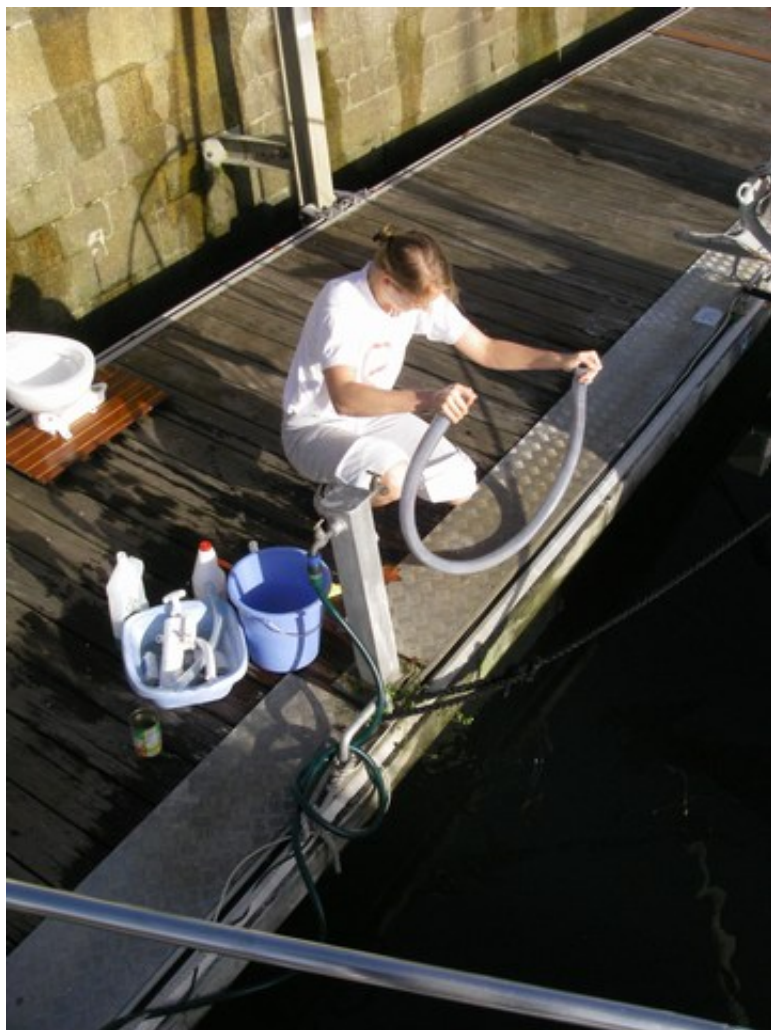
Clairette et l'eau de javel en pleine action