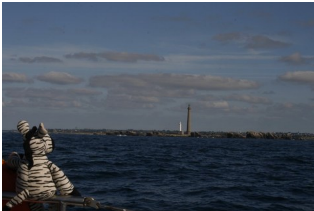
Monsieur Doudou devant le phare de l'Ile Vierge