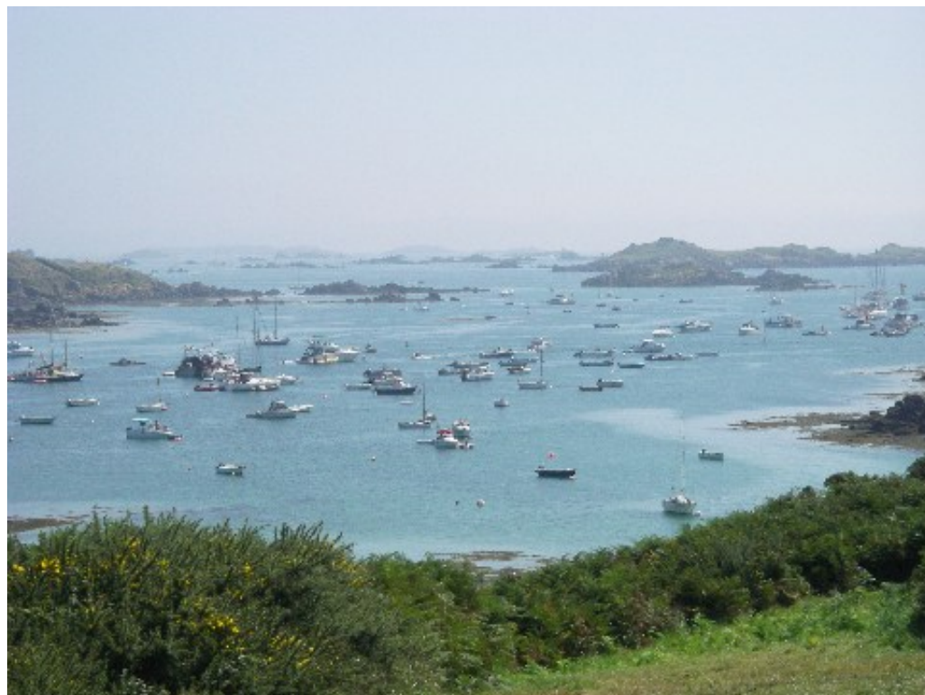
Le Sound, rempli de bateaux au mouillage.

Au retour, Schnaps n'est plus tout seul sur sa bouée, il s'est fait des copains : 4 autres bateaux, dont 1 promène-couillon - faudra quand même surveiller les fréquentations de notre bateau - arborant fièrement (pourtant, entre nous, ya pas vraiment de quoi être fier) un drapeau rouge orné de l'Union Jack. En passant leurs aussières, ces gentils voisins ont défait les protections en pare-battage qui empêchaient la bouée de taper notre étrave. Schblong, schblong, schblong. Sympa ... Notre délicat (en plus d'être impoli et désagréable) voisin de bâbord a même eu la délicatesse, au passage, de nous érafler le côté de la coque, à la hauteur de l'adhésif bleu renforçant la ligne de livet. Sympathique, encore. Bref, une bonne demie-heure passée à mettre la grosse bouée entre les 2 plus gros bateaux de la "grappe", et on n'en parlait plus, sauf lorsque nous devions envoyer promener un bateau à la recherche d'un corps-mort (non, en mer, un corps-mort n'est pas un cadavre) souhaitant se greffer sur "notre" bouée !