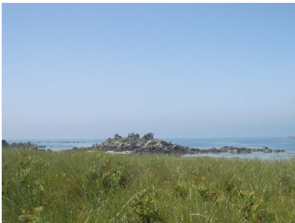
Les 3 sorcières (je sais plus si c'est vraiment 3 sorcières, Damien, mais en tous cas je me