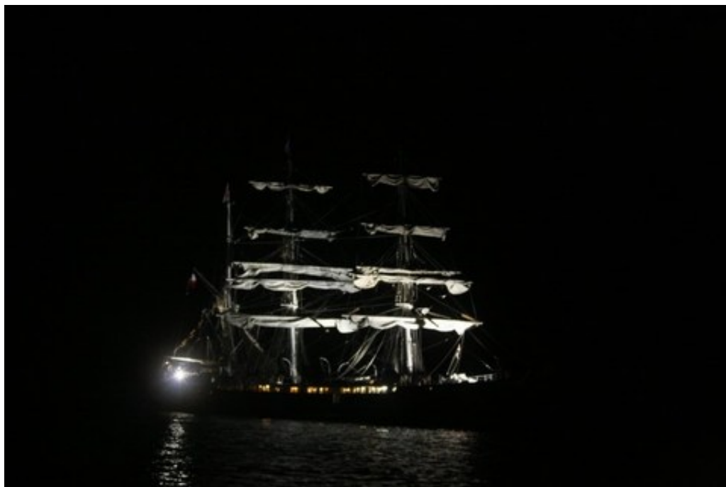
Le Belem, mouillé devant le Sound.

Quelques longueurs de plus, et nous voilà prêts à passer enfin une vraie bonne nuit presque complète (ce qu'il en reste en tous cas), aussières frappées sur la bouée des Epiettes, dédiée normalement au bateau des douanes (ou je sais plus quel navire officiel, toujours est-il que le week-end des régates de Chausey, il est pas là, le navire zozofficiel). Le problème avec cette bouée, c'est qu'elle est en ferraille, et quand elle vient malencontreusement taper contre la coque, par exemple lorsque le vent et le courant s'opposent, ça fait des gros "schblongs", non seulement désagréables pour les occupants de la cabine avant (Clairette et moi), mais aussi et surtout pour la coque du bateau ... Bref, au bout de 2 "schblongs", ce sont une Clairette et un Tomtom en petite tenue ( NDCLFC : moi je trouve que c'est pas clair, votez dans les commentaires pour nous départager, mais je préciserais qu'on était tous couchés donc en pyjama - ou en caleçon pour Tomtom - ce qui équivaut à une "petite tenue" ) qui sont allés consolider la protection constituée de pare-battages entourant la bouée. Dodo tranquille, enfin !!