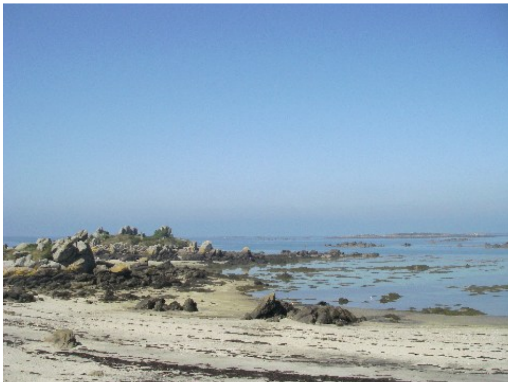
Petit promontoire rocheux