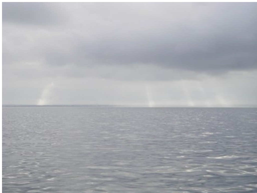
Rayons de soleil entre St Hellier et Granville

Direction Granville ! Jolie petite balade (mais pétrole, donc XUD), vue sur les Minquiers, sur Chausey, sur le Mont Saint-Michel au loin, pour arriver dans le port de Granville accompagnés d'une foule de méduses.