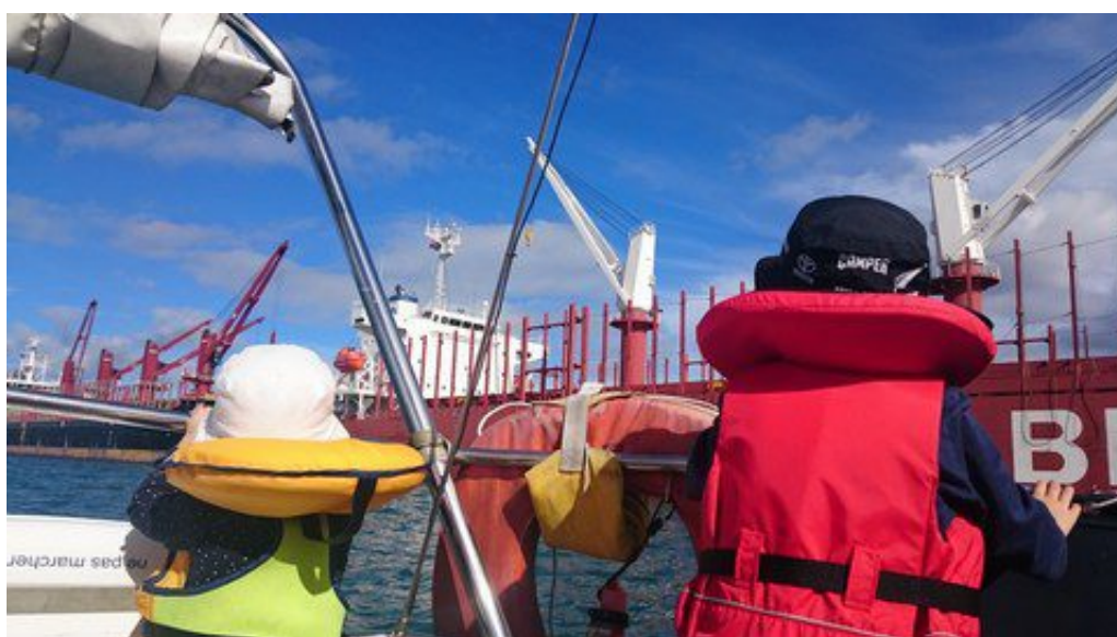
Les petits sont fascinés devant les grues des bateaux à Marsden Port