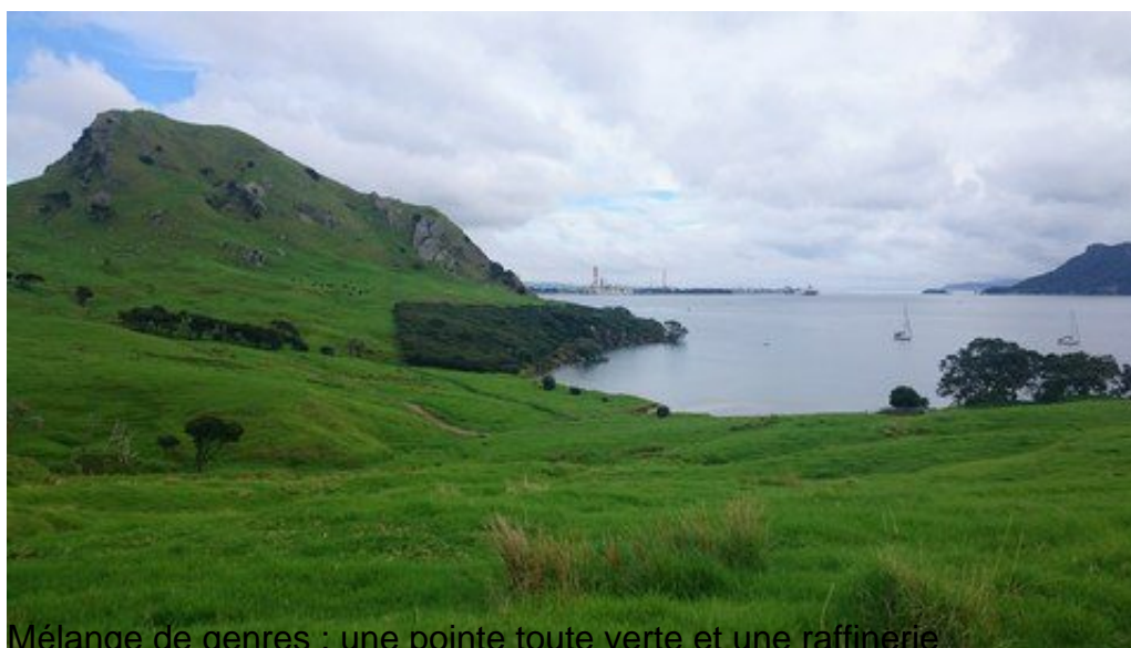
Mélange de genres : une pointe toute verte et une raffinerie