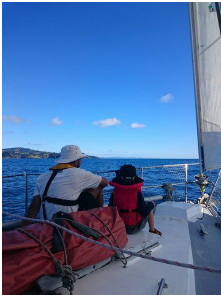
Les garçons admirent le paysage