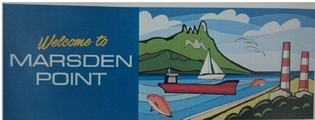
Marsden Point, sa vue sur les montagnes, son port, la voile, la pêche... et la raffinerie